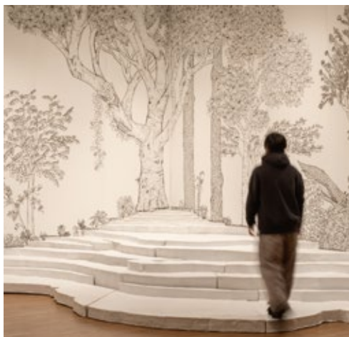
DOUBLE ANNUAL PREVIEW展 京都会場 2023 | ギャラリー・オーブ