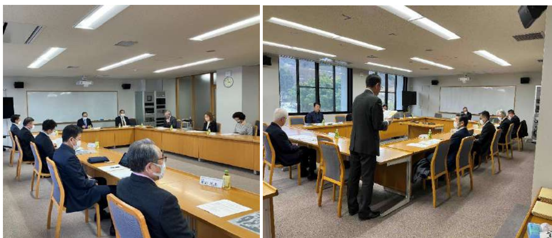
役員会の様子:第1回(左)/第2回(右)