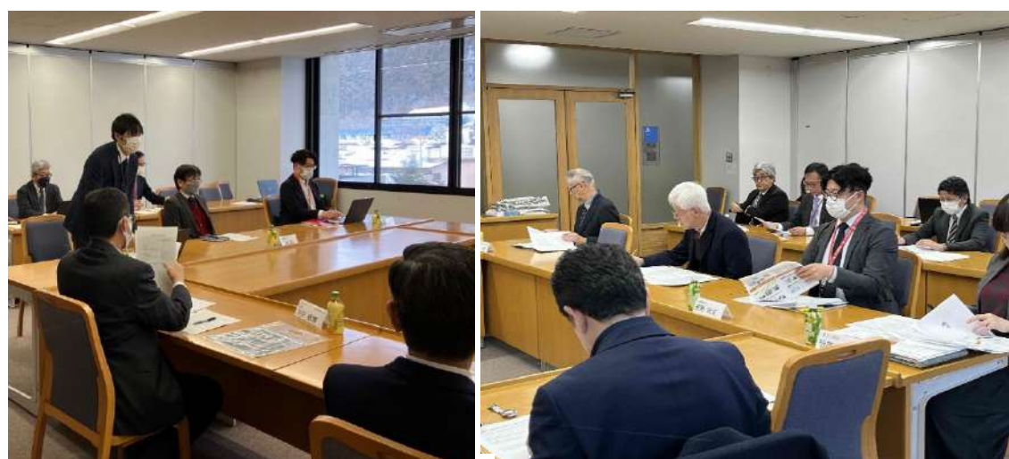
地学連携懇話会の様子:第1回(左)/第2回(右)