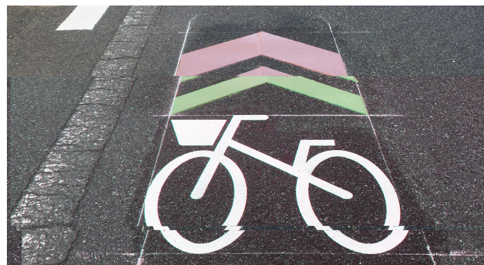
自転車走行推奨帯

そもそも「自転車共存都市」として本来あるべき姿とは、デメリットを大きくして半ば脅すような形で強制させるものではないのです。