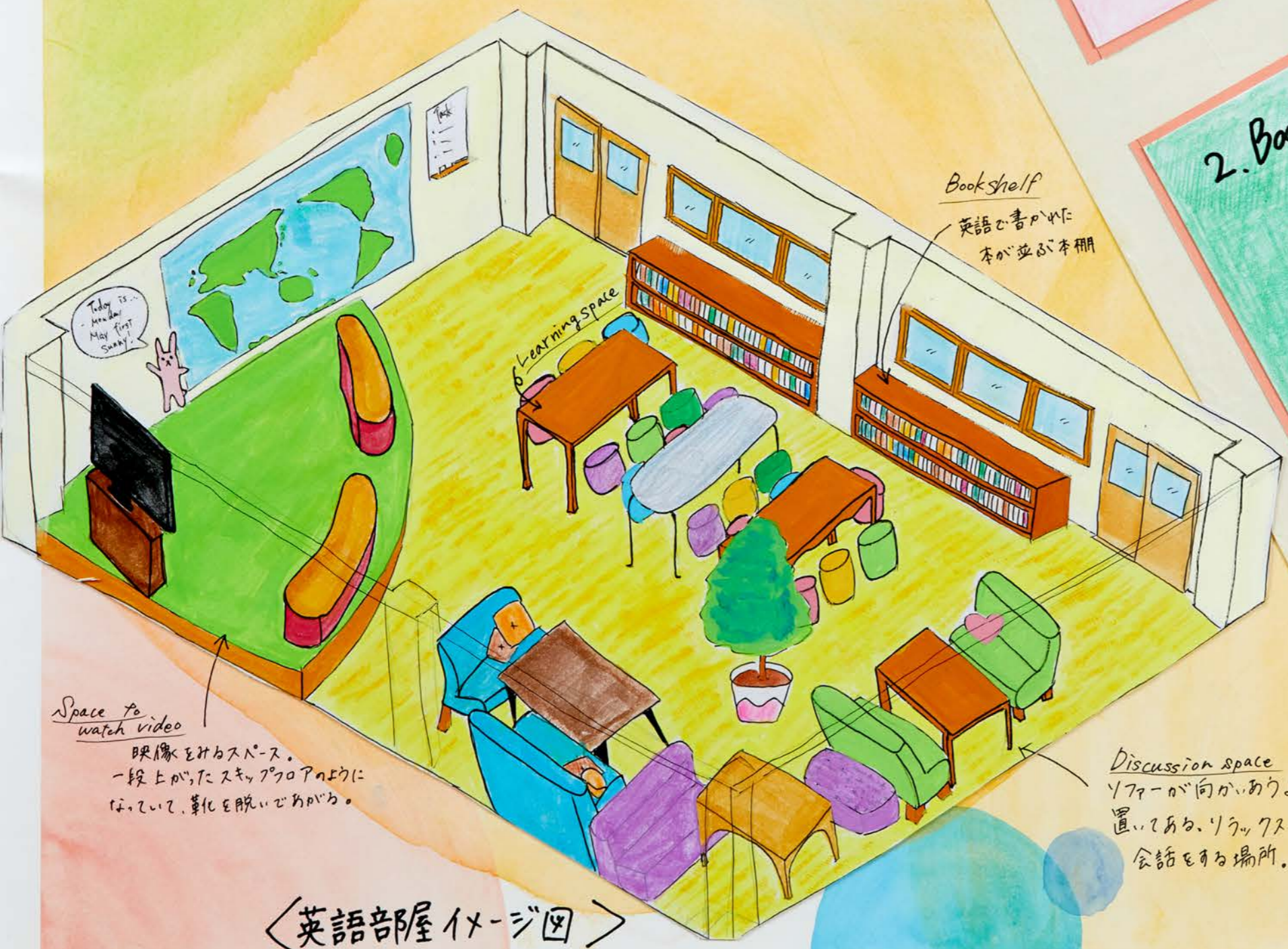
<英語部屋イメージ図>